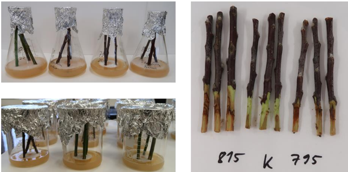
Obr. 3. Inkubace inokulovaných výhonů v Erlenmayerových baňkách a kádinkách (vlevo), odhalená pletiva segmentů výhonů při měření délky lézí (vpravo).

Přítomnost patogenu v nekrotickém pletivu se potvrdí reizolací (viz kapitola 3.2.1).