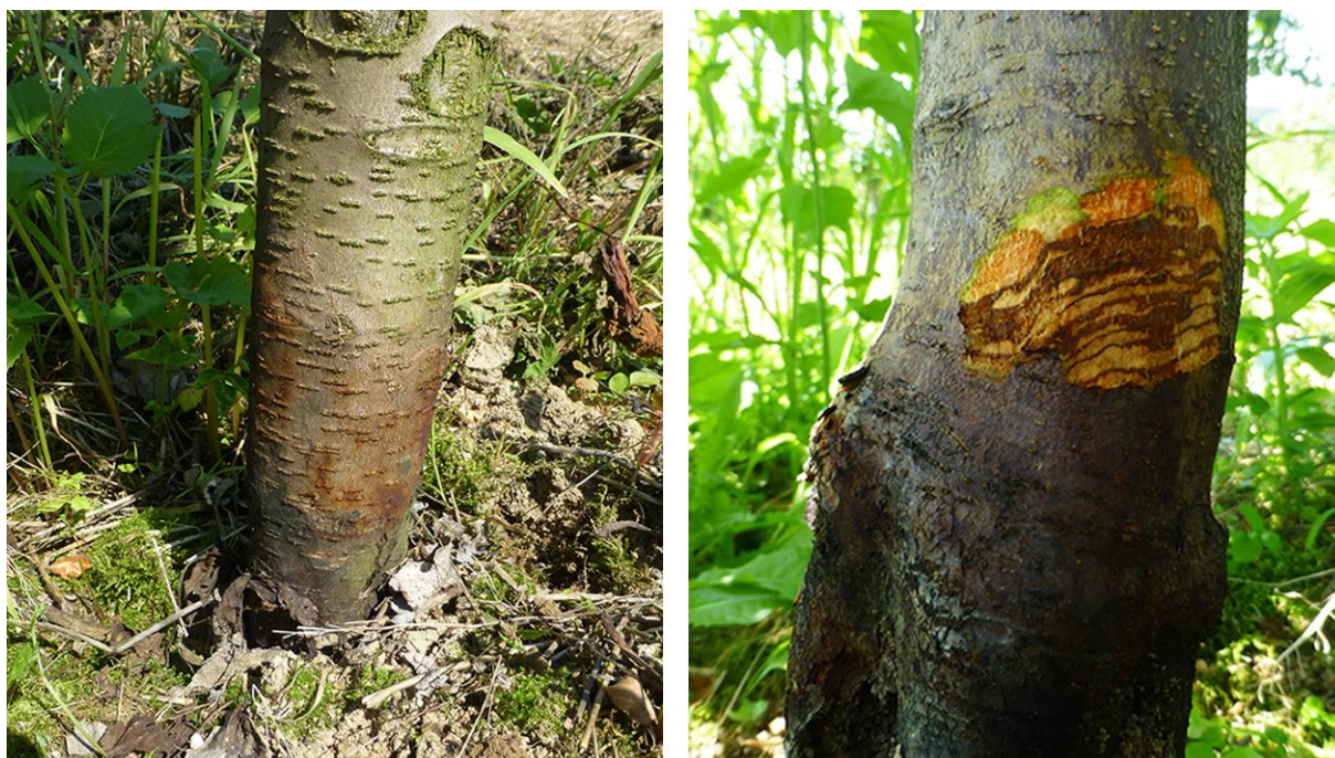
Obr. 1. Typická léze krčku způsobená P. cactorum ; vlevo charakteristické hnědavé zbarvení povrchu kůry, vpravo je po odstranění kůry viditelný přechod nekrotizovaných a zdravých pletiv.

(obr. 1 vlevo). Na těchto jedincích se dlátem z poškozených krčků odstraní borka a odhalí se vodivá pletiva, resp. přechod nekrotizovaných a zdravých pletiv (obr. 1 vpravo). Širokým dlátem se odebírají proužky vodivých pletiv 3–5 mm silné, které obsahují přechod zdravých a napadených pletiv (vzorek by měl obsahovat cca 100 cm 2 pletiv). Vzorky odebraných pletiv se uloží do sterilních PE obalů, aby nedocházelo k vysychání, kontaminaci nebo nechtěnému rozšíření patogenu. Vzorky se uchovávají ve tmě a chladu kvůli zamezení zapaření či přehřátí odebraného materiálu. Každý vzorek musí být označen číslem odběru, přesným určením lokality pomocí GPS, datem odběru a určením druhu a podnože hostitelské rostliny. Vhodný je i popis stanoviště, zdroj rostlinného materiálu (dodavatel) a pořízení fotodokumentace. Takto odebrané a připravené vzorky musí být neprodleně transportovány do laboratoře a do 24 hod zpracovány.