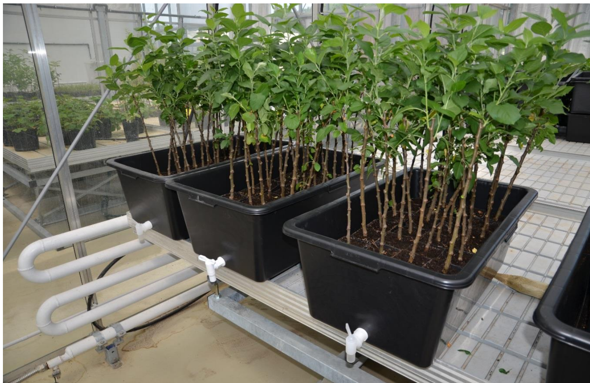
Obr. 6. Založení pokusu. Náplavové nádoby, do kterých jsou umístěny podnože po inokulaci, slouží k periodickému zaplavitelní kontejnerů vodou.

Rostliny jsou následně umisťovány do náplavových nádob. Jako náplavové nádoby se osvědčily velkoobjemové (60 l) obdélníkové černé nádoby s rozměry 40×69×28 cm bez otvorů (obr. 6). Tyto nádoby jsou následně pomocí malé technické úpravy ve spodní části osazeny malým ventilem, který umožňuje vypouštění náplavové vody. Nádoby mohou být následně umístěny na rošty nad náplavovými stoly. To umožňuje jednoduché vypouštění vody právě do náplavových stolů, kde může být voda sbírána a centrálně odváděna do dezinfekční kádě.