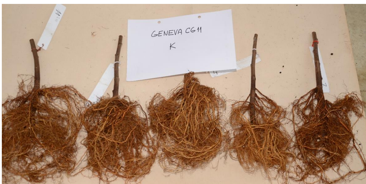
Obr. 8. Propláchnutý kořenový systém podnože Cornell Geneva 11.