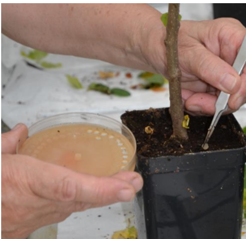
Obr. 5. Inokulace, vkládání agarového terčíku do substrátu.