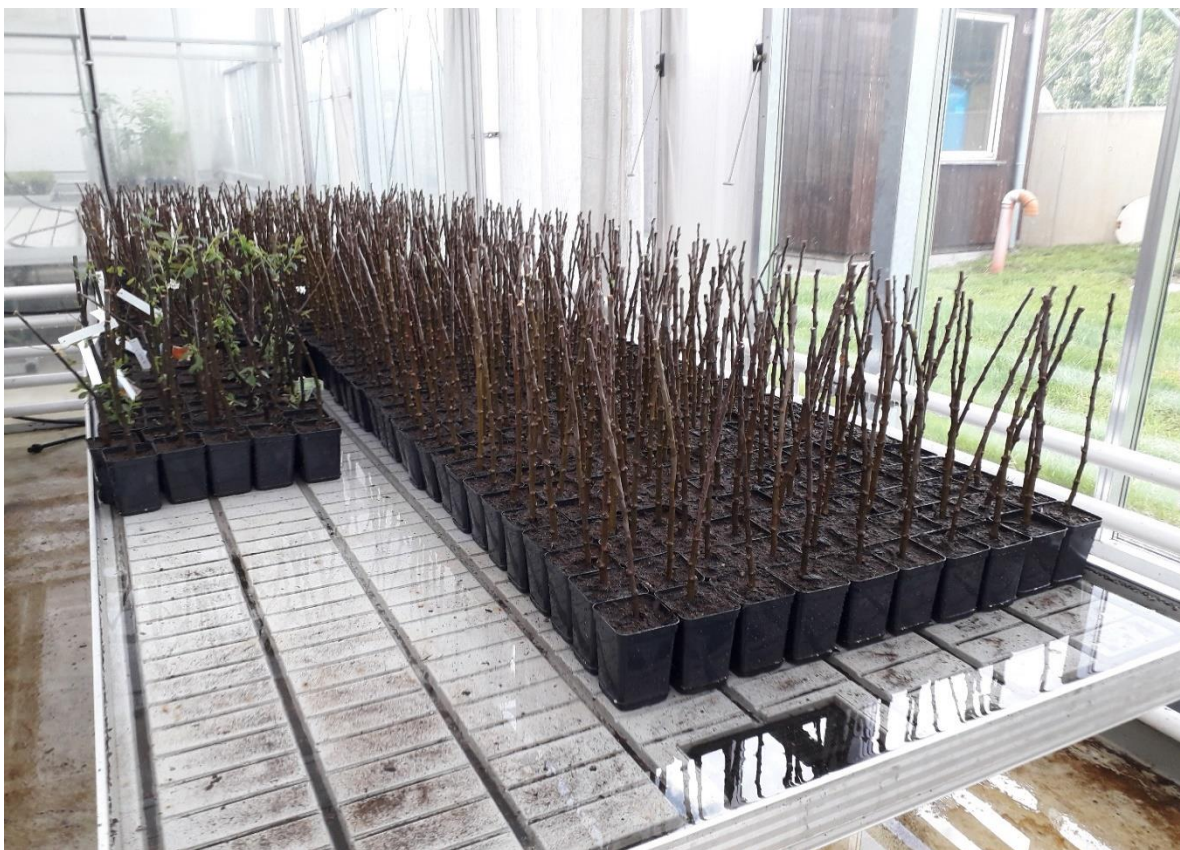
Obr. 4. Pěstování podnoží určených pro následné testování.