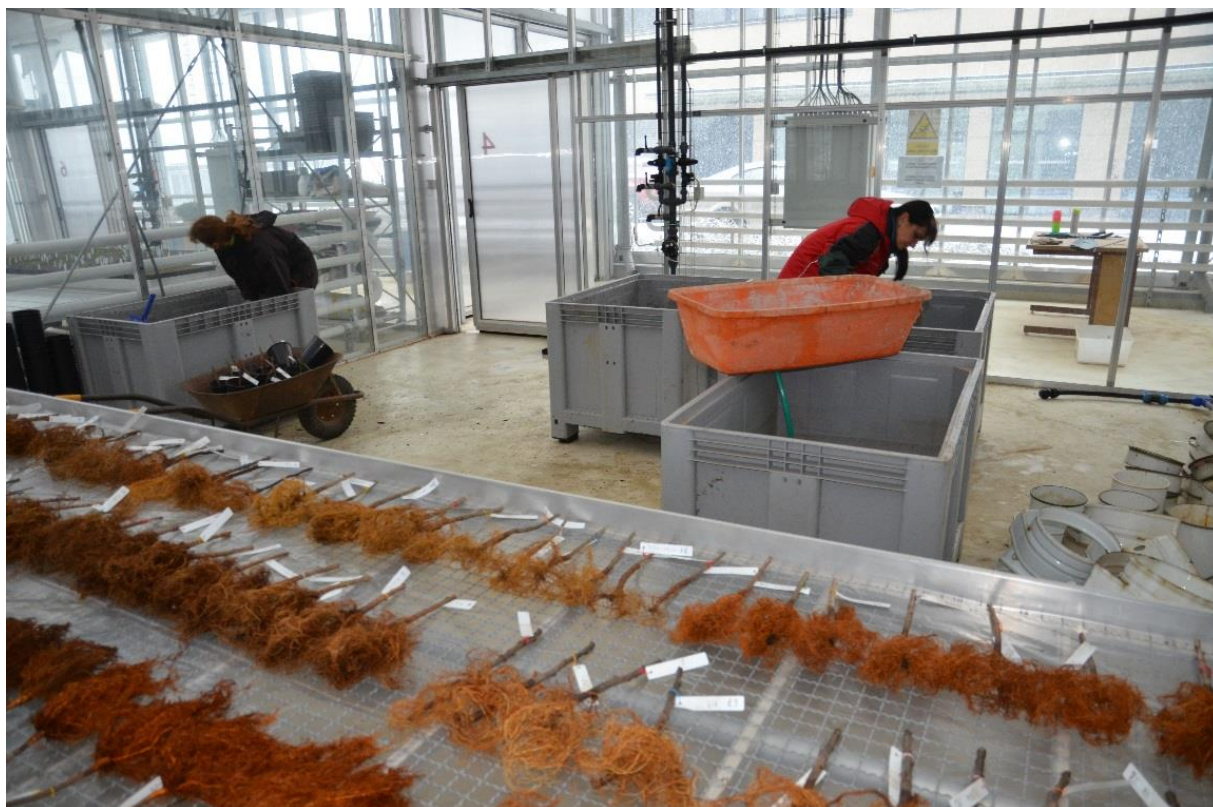
Obr. 7. Vyplavování substrátu z kořenového systému pokusných rostlin.

„na sucho“, nebo „na mokro“ vyplavováním v kádi s vodou. Následně je kořenový systém vyplachován v čistší vodě, aby byl zcela zbaven substrátu (obr. 7 a 8). Rostliny jsou postupně umisťovány na vhodnou podložku, kde je provedena fotodokumentace a je možné provést vizuální hodnocení stavu kořenů. Zaznamenává se velikost, hustota a rovněž barva kořenů a výskyt příznaků infekce (odumřelé hnědě či černě zbarvené kořeny). Velmi vhodné je zaznamenání procentuálního podílu hniloby kořenů.